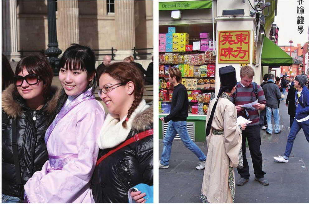
図8 英論漢風（漢服サークル）が街中の姿〔1〕