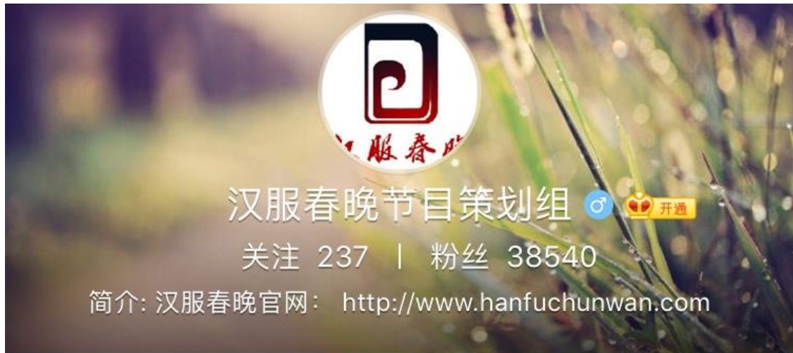
図 1 3 漢服春晚の“weibo”、2018年1月1日の時点でのファン数が38540人。[11]