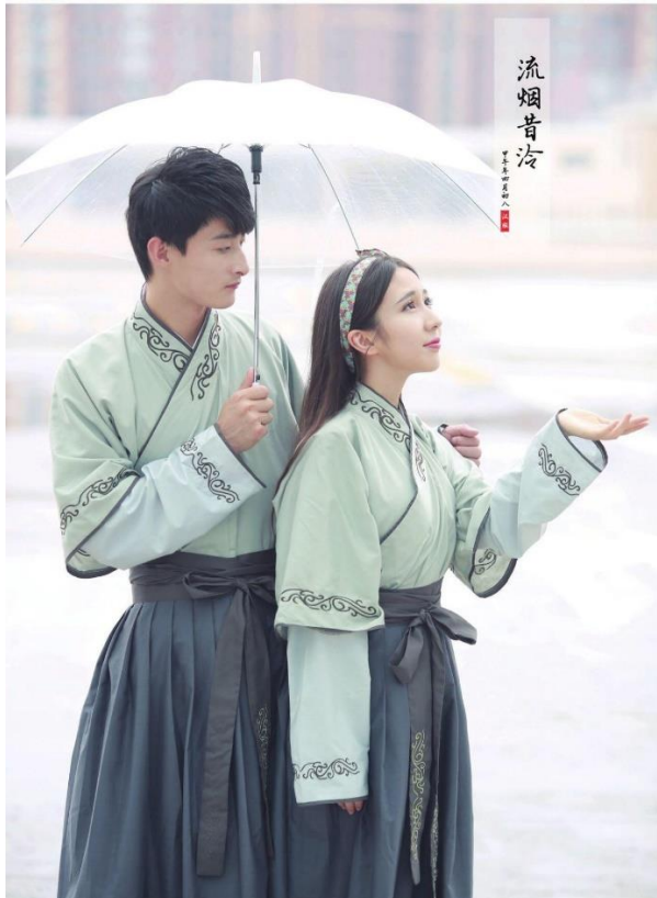
図6 流煙昔冷の漢服カップル衣装 [1]

2006年3月1日漢衣坊、最初は約321万円から481万円を損した。しかし、その後、いろいろな漢服のウェディング専門店が風のように成立した（図7）。