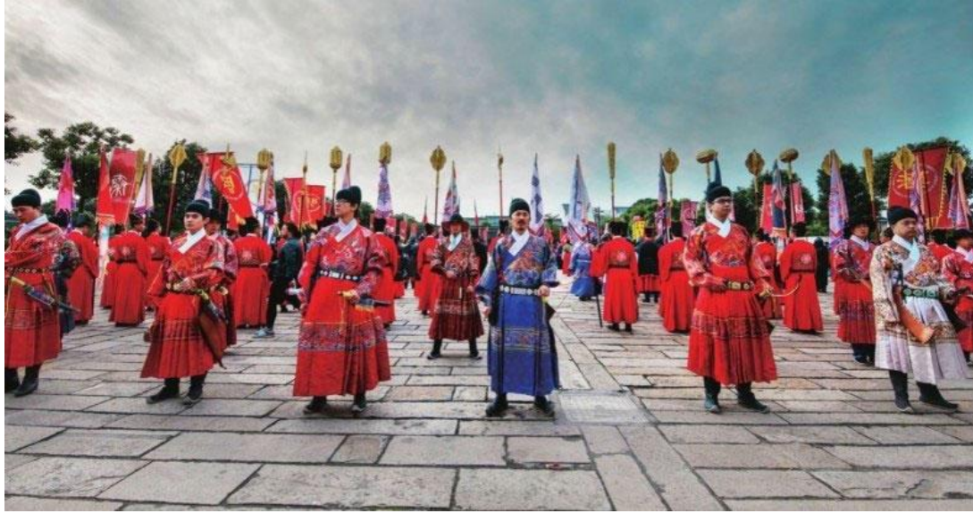
図10 2015 漢服文化周開場式 [2]