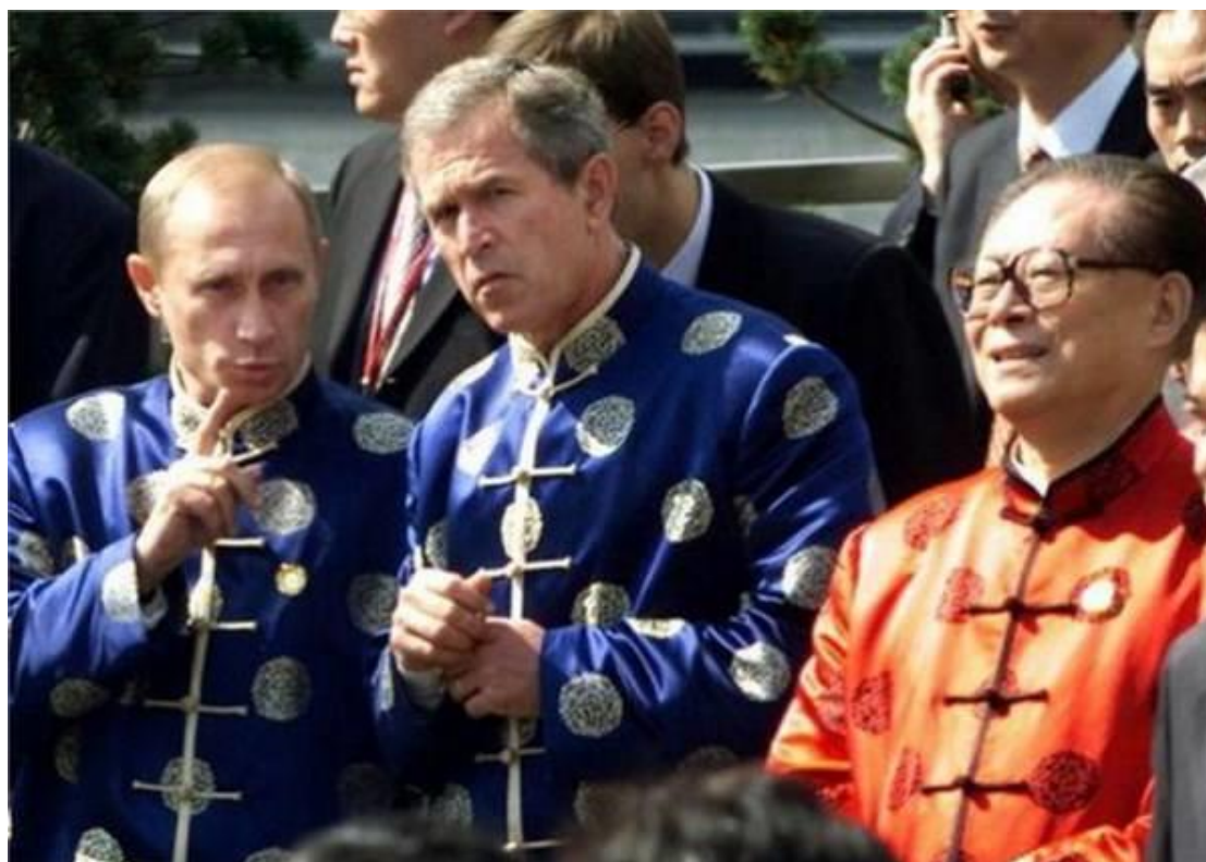
図 1 2001 年 10 月の APEC 会議の“唐装” [ 1 2 ]

APEC 会議の唐装の刺激で漢服という言葉が生まれた。中国は 56 カ民族があり、民族衣装は国内、海外にとはず文化の印であり、漢族以外の民族は重大な会議に参加する時は常に民族衣装を着て参加する。そして民族衣装は他民族と分別する特徴である。[ 7 ] 2001 年 10 月の APEC 会議で各国が中国の伝統衣装を着て集団写真を撮ったことで注目を浴びた、そこで唐装（図 1）が伝統衣装として各国のトップに着せられたことで“中国の伝統服装は何か”という議論があった。議論後、漢服という名前が出た。