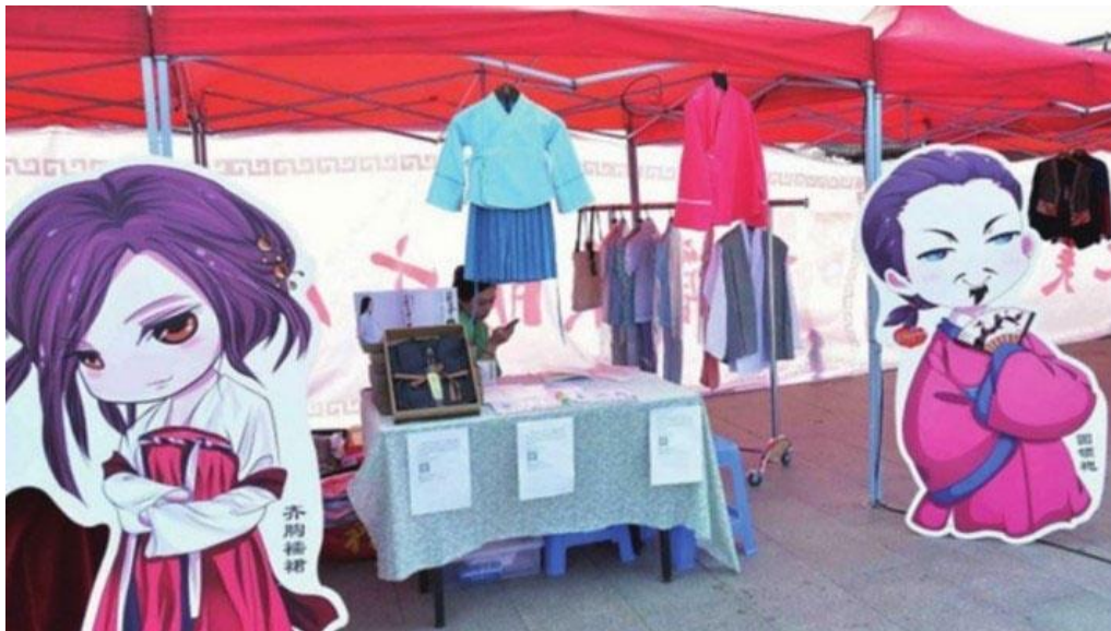
図11 2013年 漢服関連物の市 [2]