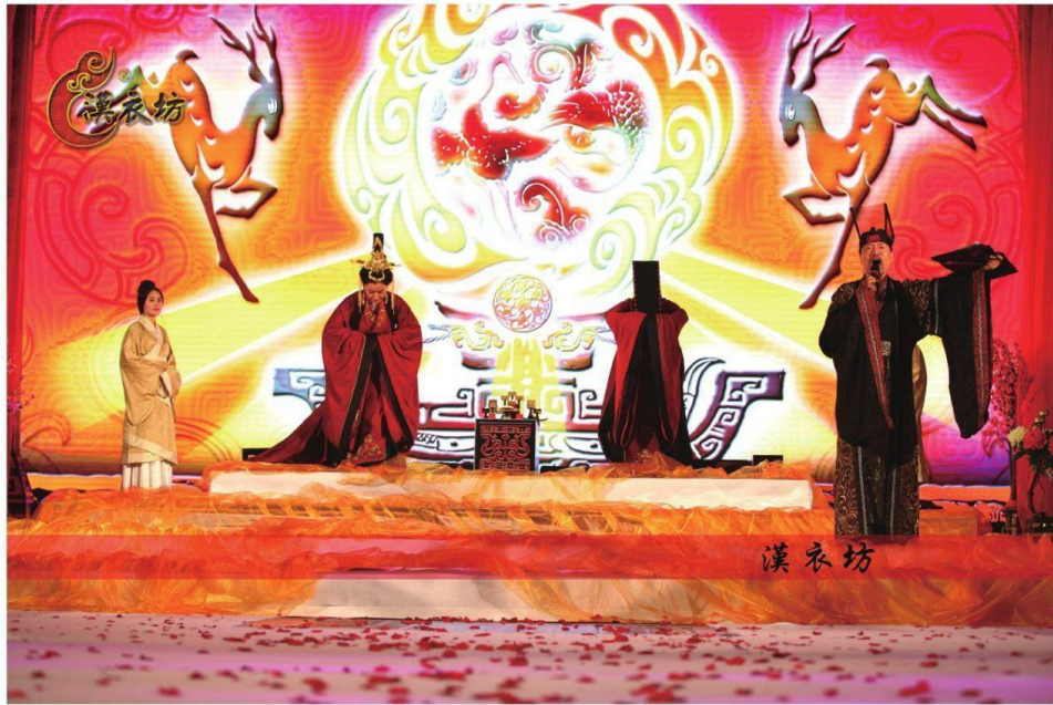
図7 漢服のウェディング専門店の“漢婚”現場 [1]