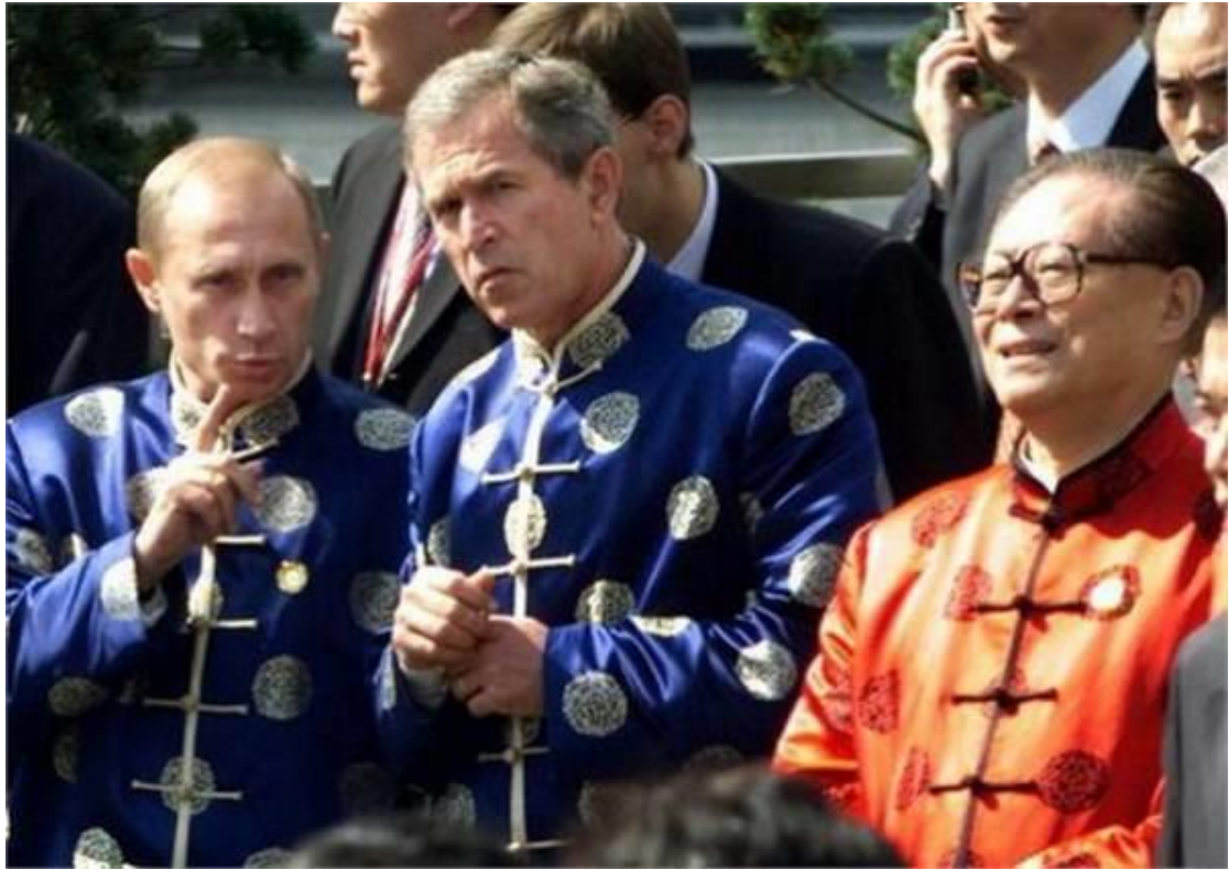
図1 2001年10月のAPEC会議での“唐装” [12]