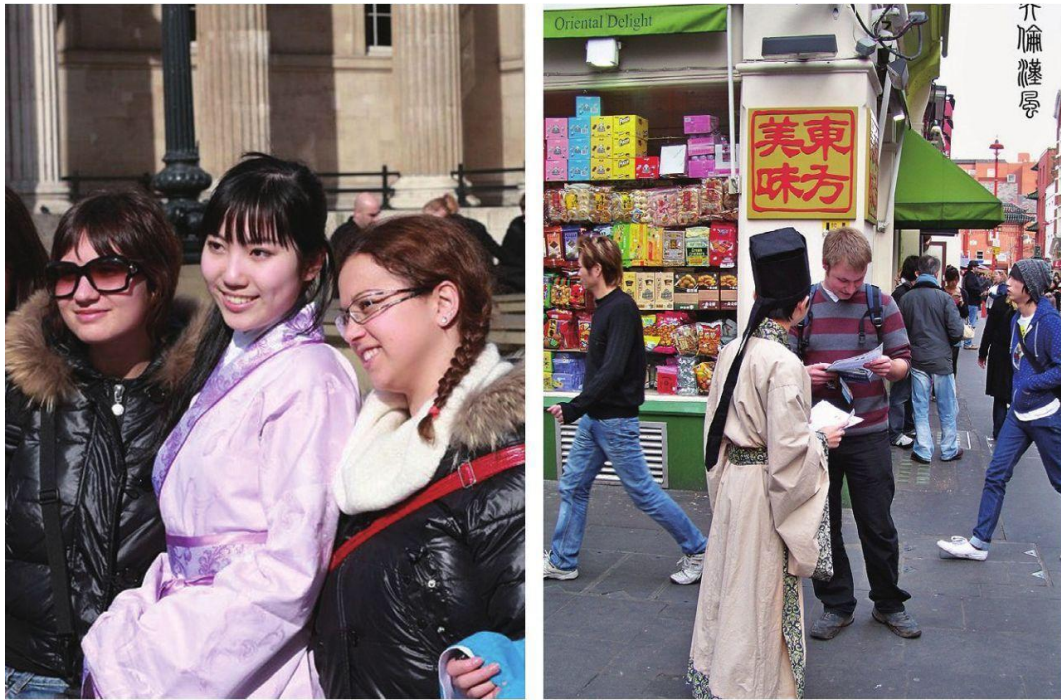
図8 英論漢風（漢服サークル）が街中の姿 [1]