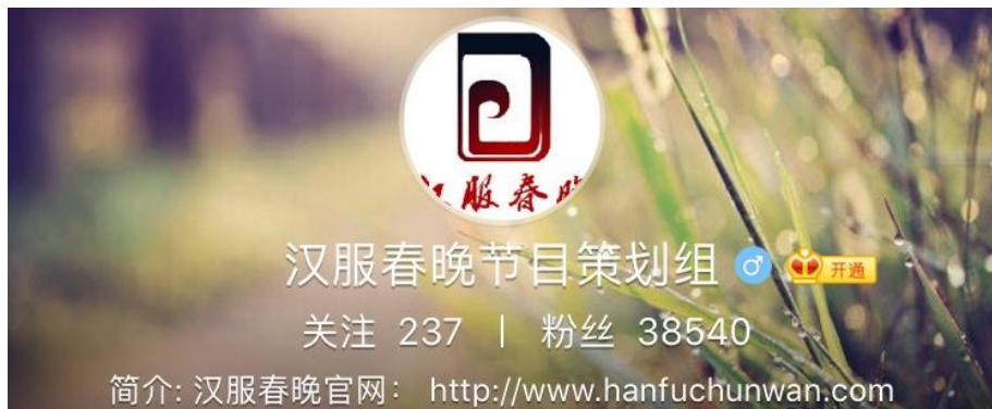
图 13 汉服春晚の“weibo”（新曆 2019 年 1 月 1 日のファン数が 3 万 8540 人） [11]