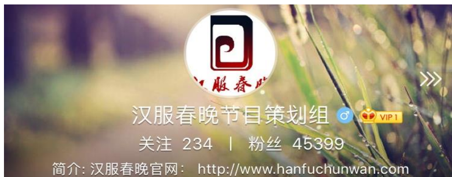
图 14 汉服春晚の“weibo”（新曆 2019 年 1 月 29 日でファン数が 4 万 5399 人）