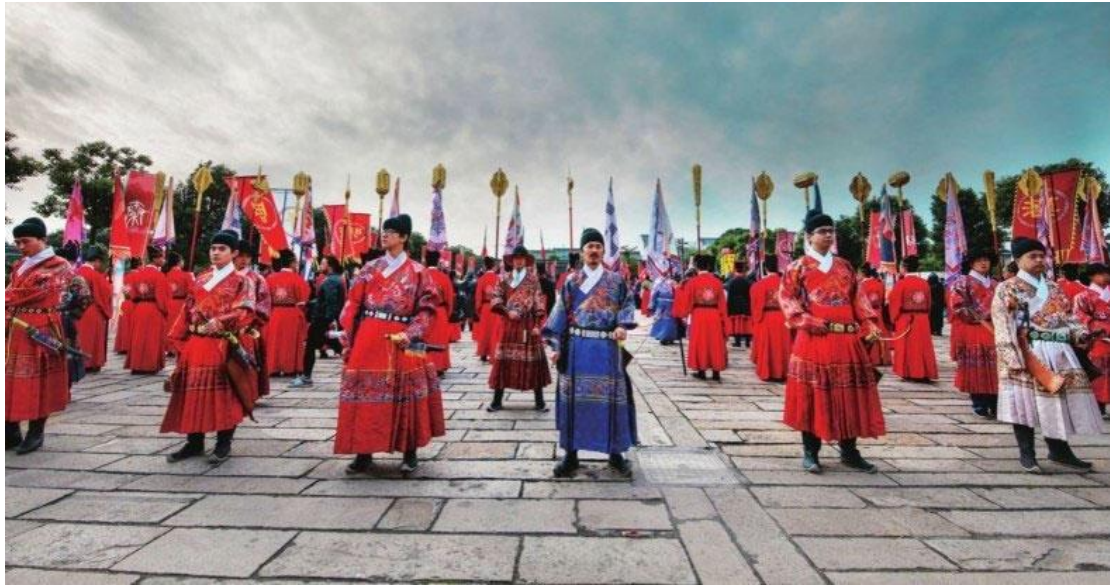
図10 2015 漢服文化周開場式 [2]