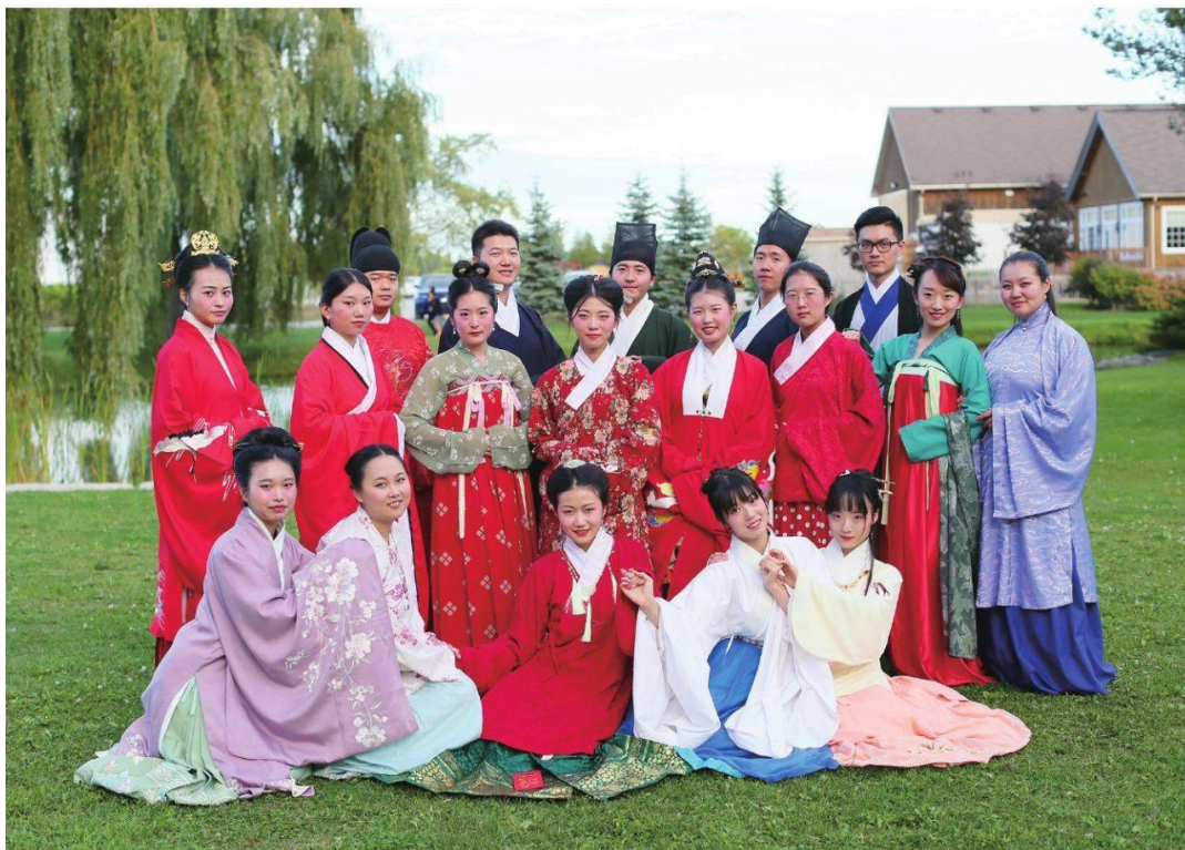
図9 英国で漢族女子の成人式写真 [1]