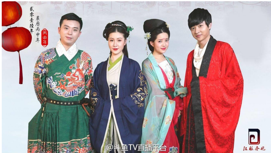
图 1 2 2016 年の汉服春晚の司会者たち [11]