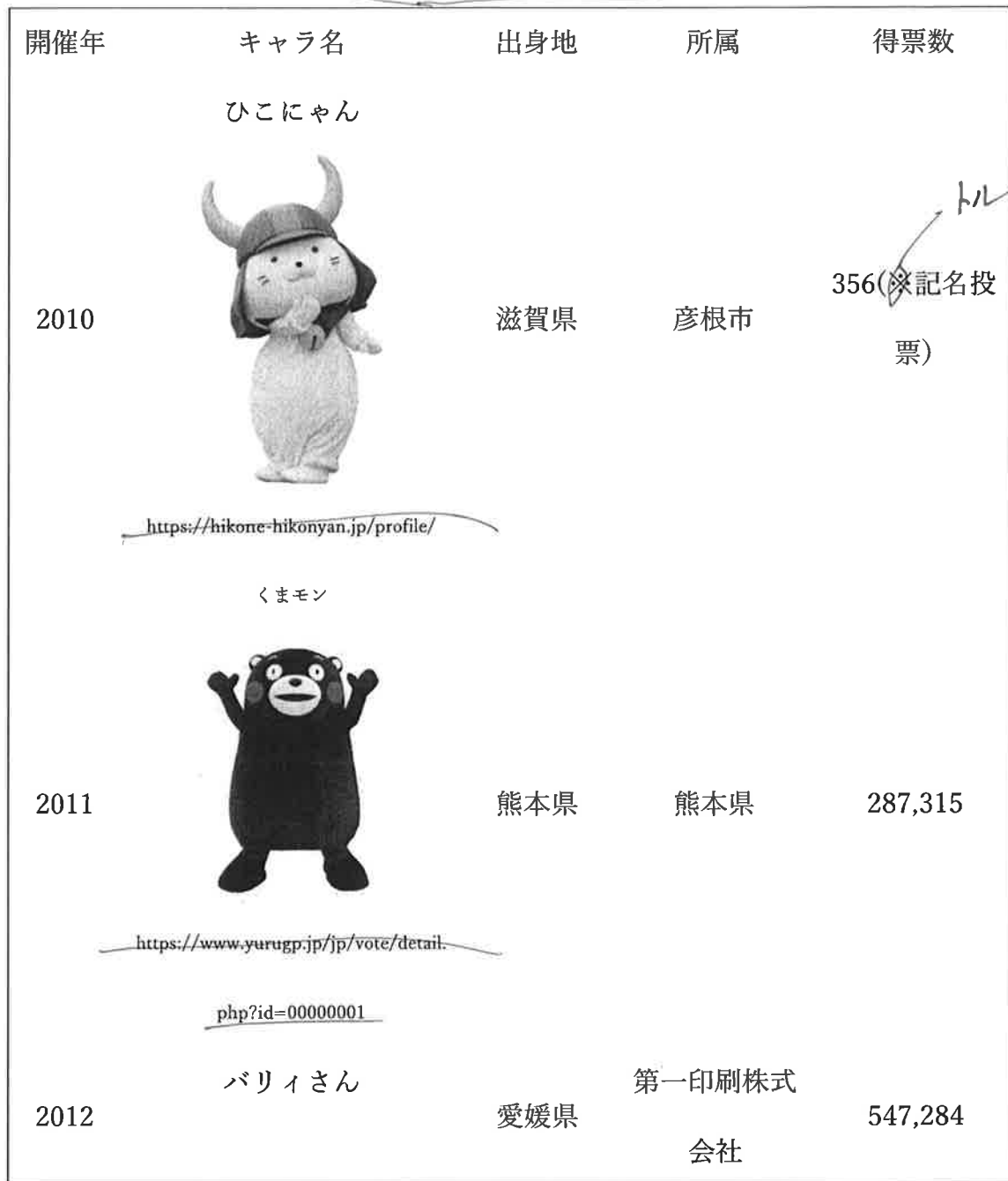
表1 タイトル [6]