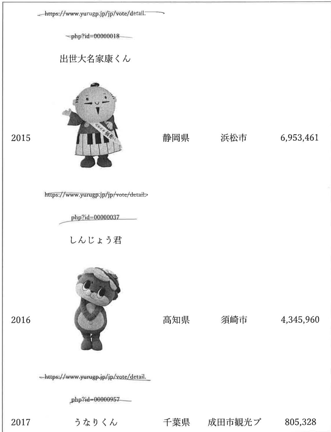
表1 [6] (つづき)