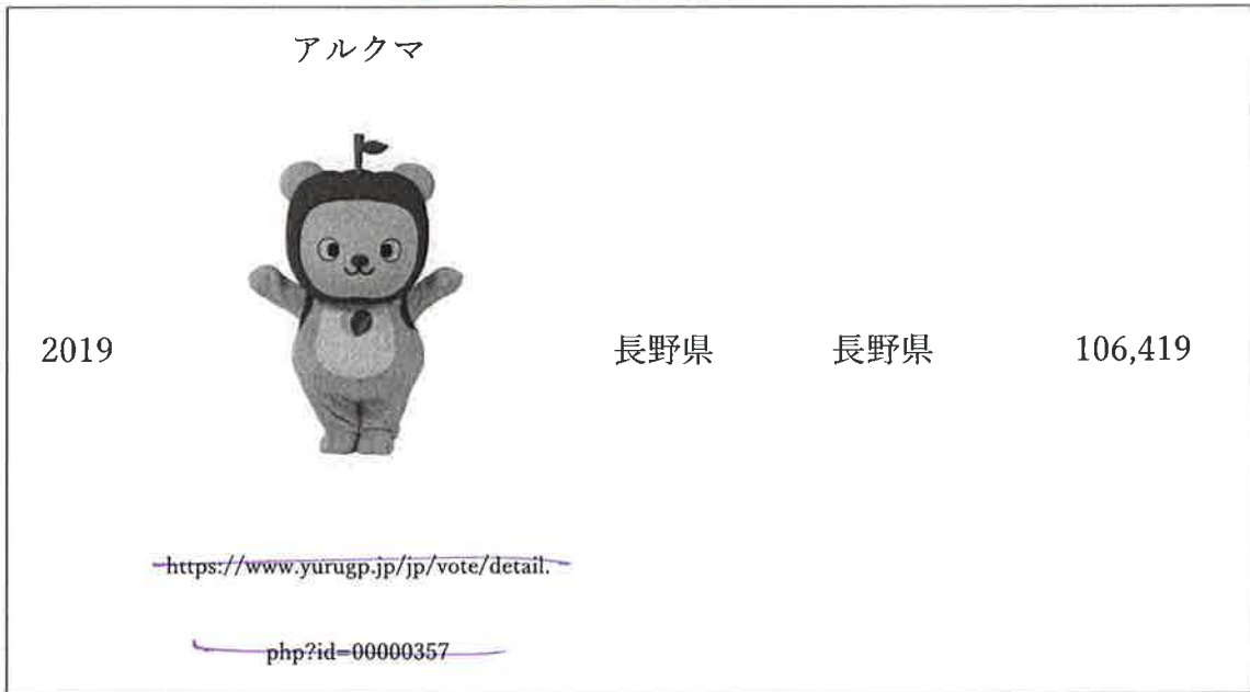
表1 [6] (つぶき)