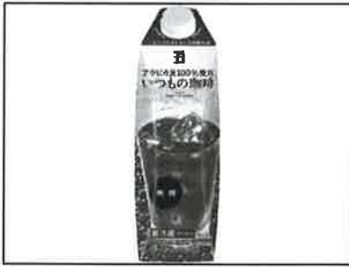
1 アラビカ豆商品を謳ったコーヒー

世の中には高品質なコーヒーを謳った商品が数多く存在する。「AA」、「アラビカ豆 100%」、「スペシャルティコーヒー」といった商品だ。これらのコーヒーは各組織や団体が定めた評価基準をパスしたことで高品質としての付加価値を得る。コーヒーにおける品質の善し悪しはその豆独特の味や香りに大いに関係している[1]。一部の専門家達は味の濃さ、バランスの良さや香りの強いものが高品質なコーヒー[2]としてあげており、それは言外に「高品質＝おいしい」という認識を秘めている。だが、評価基準の定義は曖昧で不確定な要素が多い。さらに組織間における基準は組織によって異なり統一性がない。にもかかわらず、あらゆるコーヒー豆は一部の専門家によって高品質の認証を得たコーヒーとして消費者に伝わるのである。