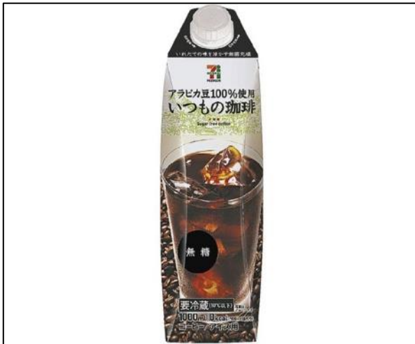
[図 1] アラビカ豆 100% を謳った標品の例

あらゆるコーヒー豆は、一部の専門家によって高品質の認証を得たコーヒーとして消費者に伝わっている。