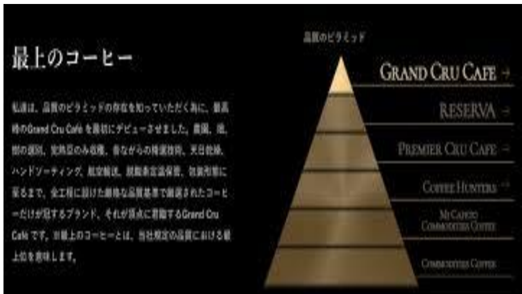
図4 ミカフェートの品質評価の例

こうした企業または個人事業の努力の結果、コーヒー事業者の多様性が生まれ、消費者が目に入るコーヒー豆の種類は増加した。